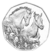
Freunde fürs Leben