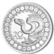
Australien – Schöpferkraft der Schlange