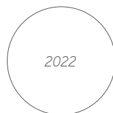
Asien – Stärke des Tigers