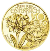
Am höchsten Gipfel